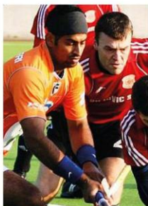
Un'azione della Fincantieri