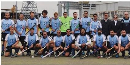
La Fincantieri Leyline al gran completo