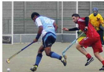
Fuga per la vittoria per la Fincantieri che vede la A1 sempre più vicina

Merito ulteriore, quindi, l'essere usciti con i 3 punti da una vera e propria trappola, a conferma che la mentalità vincente, la capacità di tenere i nervi sotto controllo, è ormai consolidata e che difficilmente questo gruppo lascerà un minimo spazio al tentativo di rimonta in classifica della Juvenilia Uras,