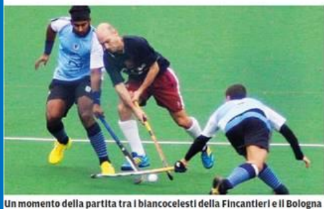
Un momento della partita tra i biancocelesti della Fincantieri e il Bologna