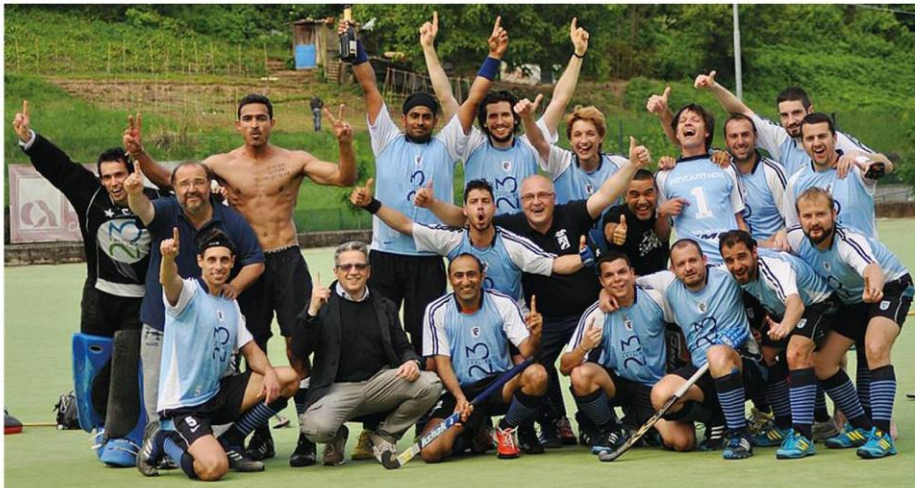
La grande festa di giocatori, tecnici e dirigenti della Fincantieri Leyline al termine della partita di Moncalvo che ha significato promozione in A1

Una gioia, quella monfalconese, che è di tutto il movimento regionale e che viene condivisa con Trieste, il capoluogo, che nel lontano 1948 regalò al Friuli-Venezia Giulia l'unico scudetto dell'hockey su prato: i club storici triestini sono confluiti negli ultimi 17 anni nel sodalizio del caposegretario Paolo Pacor, la cui lungimiranza, la passione e la capacità di tradurre in fatti concreti anche i sogni (grazie alla Fincantieri Hockey in via Atleti Azzurri è stato costruito un campo in erba sintetica,