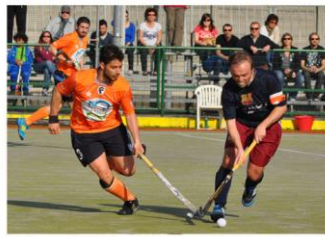
Un'altra vittoria per la Fincantieri Leyline: 7-1 il finale contro il Bologna