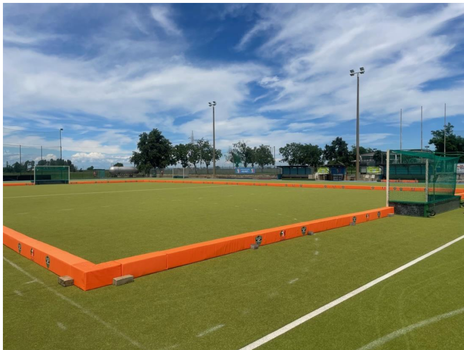
(sponde omologate Federhockey, interamente in gomma)